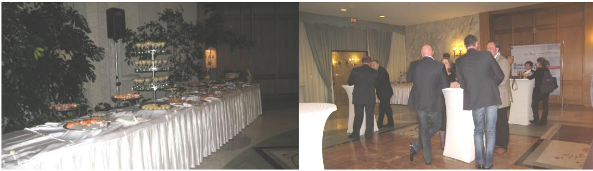
Фото 337 и 336. Во время коктейля идёт оживлённая беседа за всеми столами. Люди неспешно говорят о сокровенном, своих трудностях и успехах.