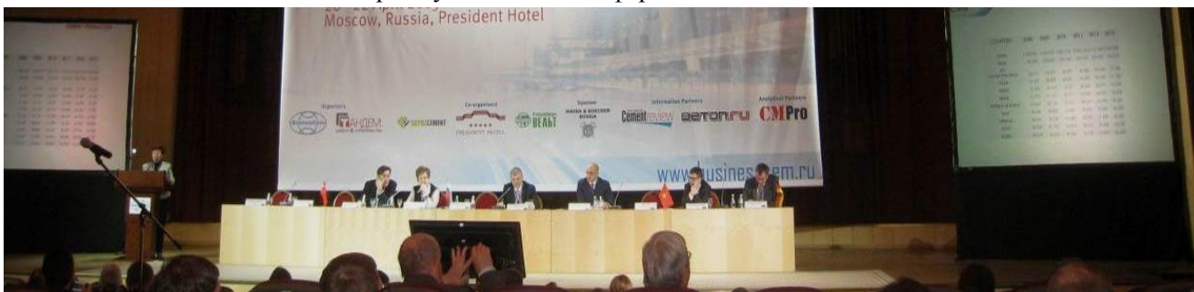
Фото 331. Президиум конференции.