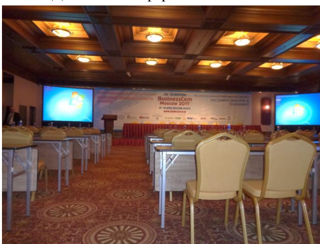
Фото 482 и 495. Всё готово к встрече участников конференции.