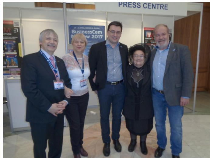
Фото 330. Фасад Президент Отеля. Москва. Фото 523. Делегаты конференции