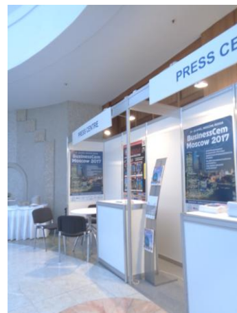
Фото 492. В.П. Кузьмина. Фото 503 и 501. Выставка